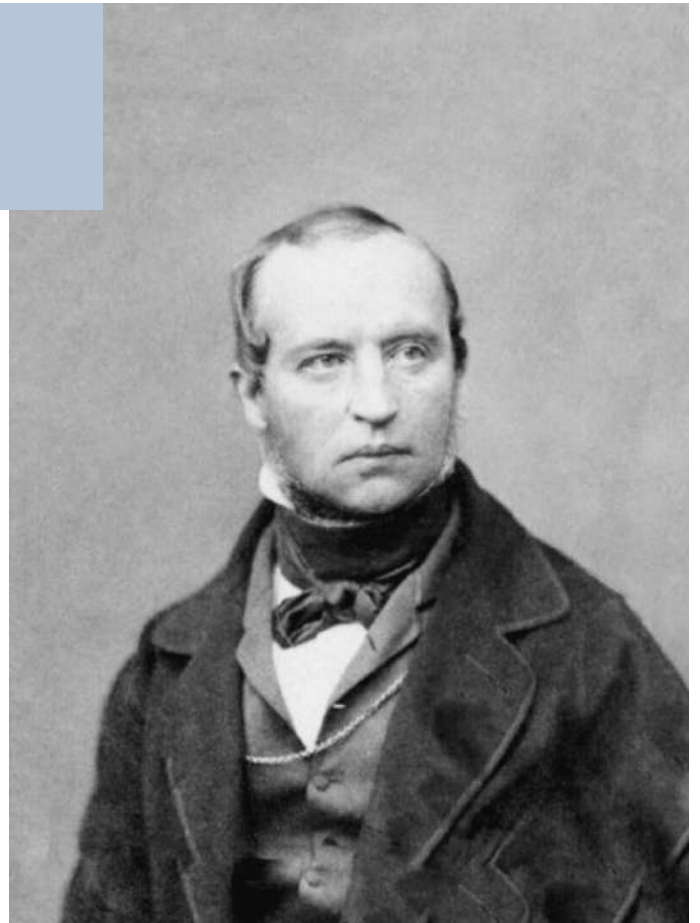
Фотопортрет князя Владимира Одоевского, автор - Сергей Левицкий, 1856 год

Писатель уделял большое внимание проблеме сиротства. Он спонсировал организацию и благоустройство детских приютов. В 1839 году