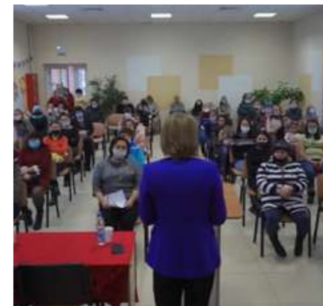
Презентация проекта, АИФ-Воронеж

18 января этого года мы провели такой киноурок в селе Круглянское Каширского района. В начале посмотрели короткометражный фильм с детьми в школе, подискутировали, обменялись эмоциями. Затем, этот же фильм посмотрели в местном Доме культуры с родителями и педагогами. Педагоги со своей стороны рассказали родителям о восприятии этого фильма детьми, об